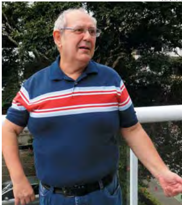
Atrofia no braço não impediu Del Rey de trabalhar por 36 anos