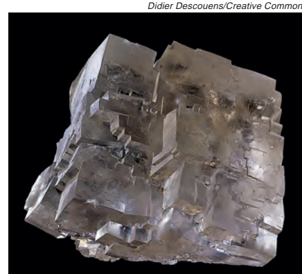
O cloreto de sódio é um dos cristais do cotidiano

Não há um prazo definido para a conclusão dos experimentos, visto que a RSC mantém as diferentes edições do “Experimento Global” ativas em seu site. Em 2013, quando o tema escolhi-