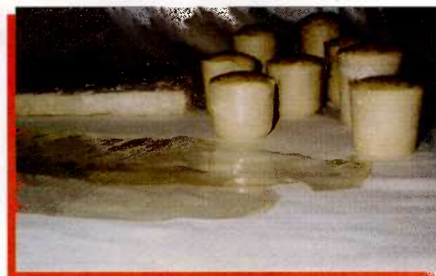
Figura 1 - Corpos-de-prova da Espuma Rígida de Poliuretano desenvolvida