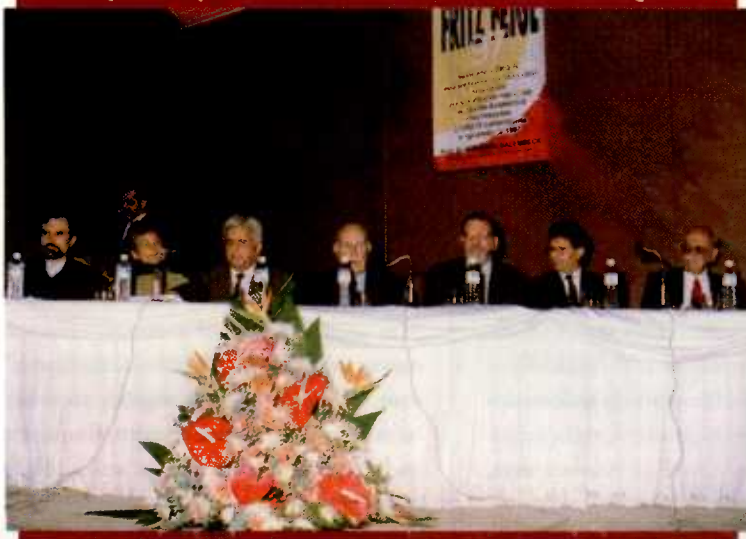
Mesa que compôs os trabalhos do II Prêmio Fritz Feigl.