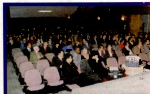
Vista geral do auditório: grande interesse pela premiação.