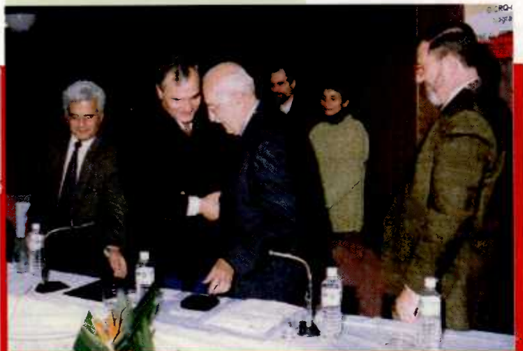
Momento da entrega do prêmio: Emoção.